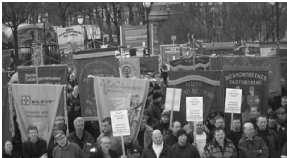
Fanemarkering foran Stortinget 17. mars mot forverring av Arbeidsmiljøloven og undergraving av Folketrygden.