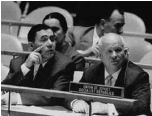
Nikita Krustsjov (her sammen med utenriksminister Andrej Gromyko) var tidlig ute med «hele folkets stat».

ble lansert på 50-tallet (se egen ramme). Det antimonopolistiske demokrati bygger på illusjonen om et mellomstadium hvor (den borgerlige) staten reelt begynner å tjene, og skrittvis erobres av folket.