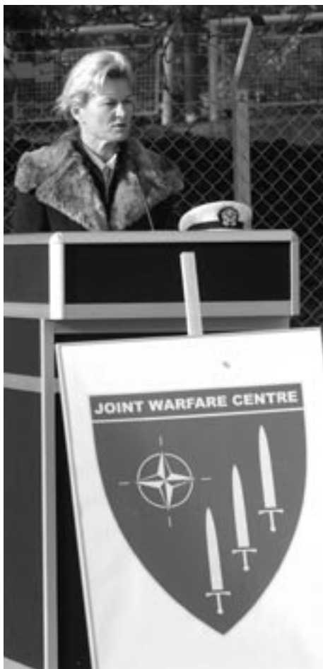
Den skandaleombruste krigsminister Kristin Krohn Devold ved Joint Warfare Center i Stavanger.