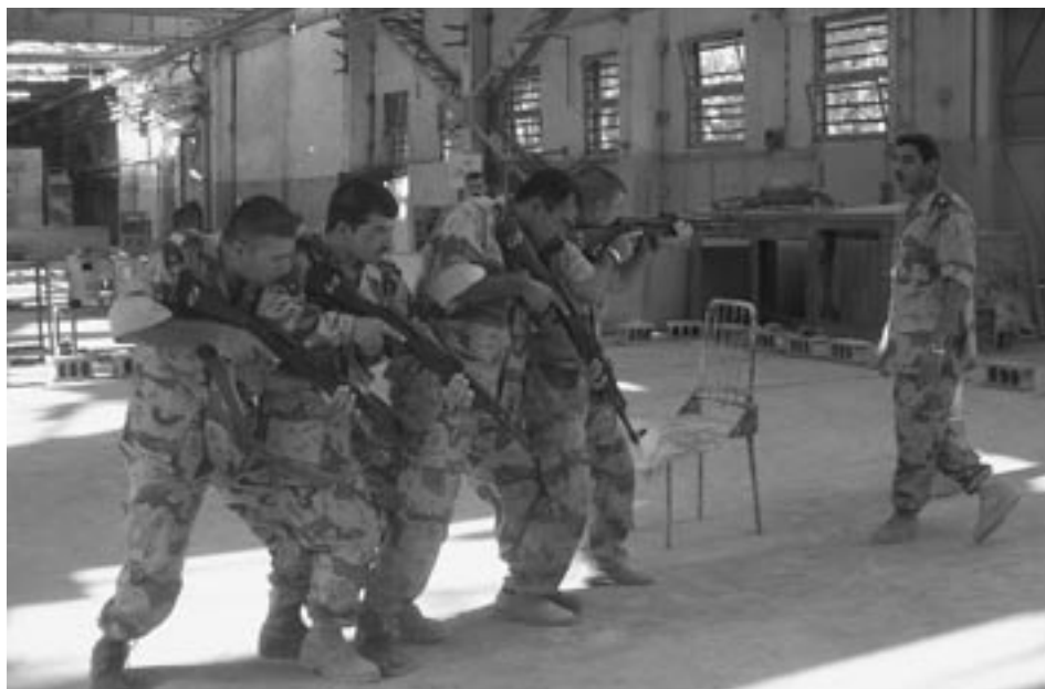
Sånn foregår opplæringa av styrkene i Irak.